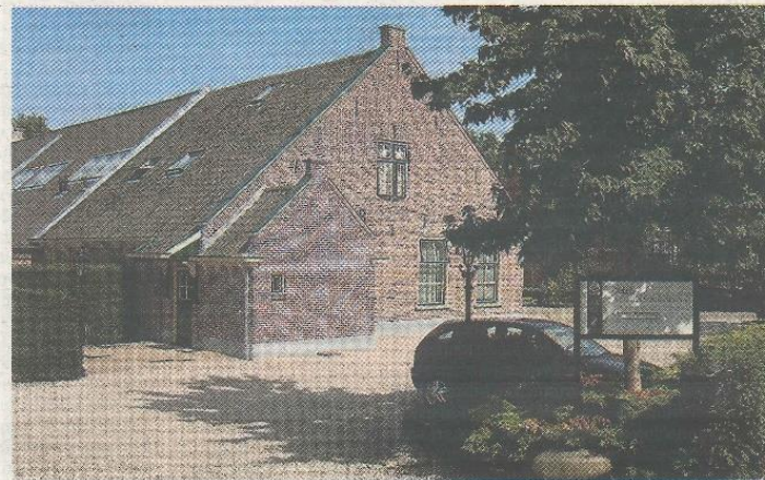
Het uitvaartcentrum aan de Beemsterboerstraat was van 1974 tot 2005 in gebruik.