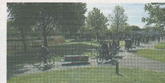
Een door Rebel verzorgde fietsuitvaart in Lelystad.