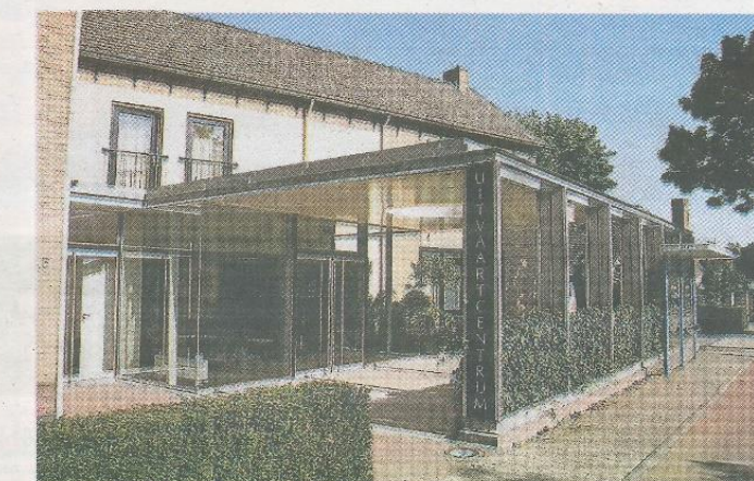
Het nieuwe uitvaartcentrum aan de Ceintuurbaan, in 2005 in gebruik genomen.