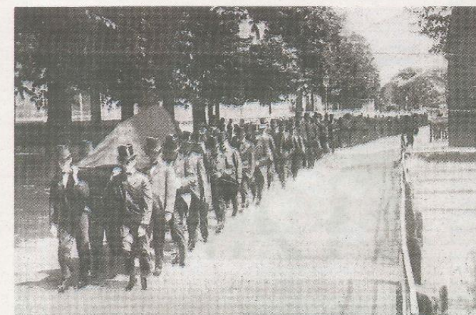
Een begrafenistoet in vroeger tijden.